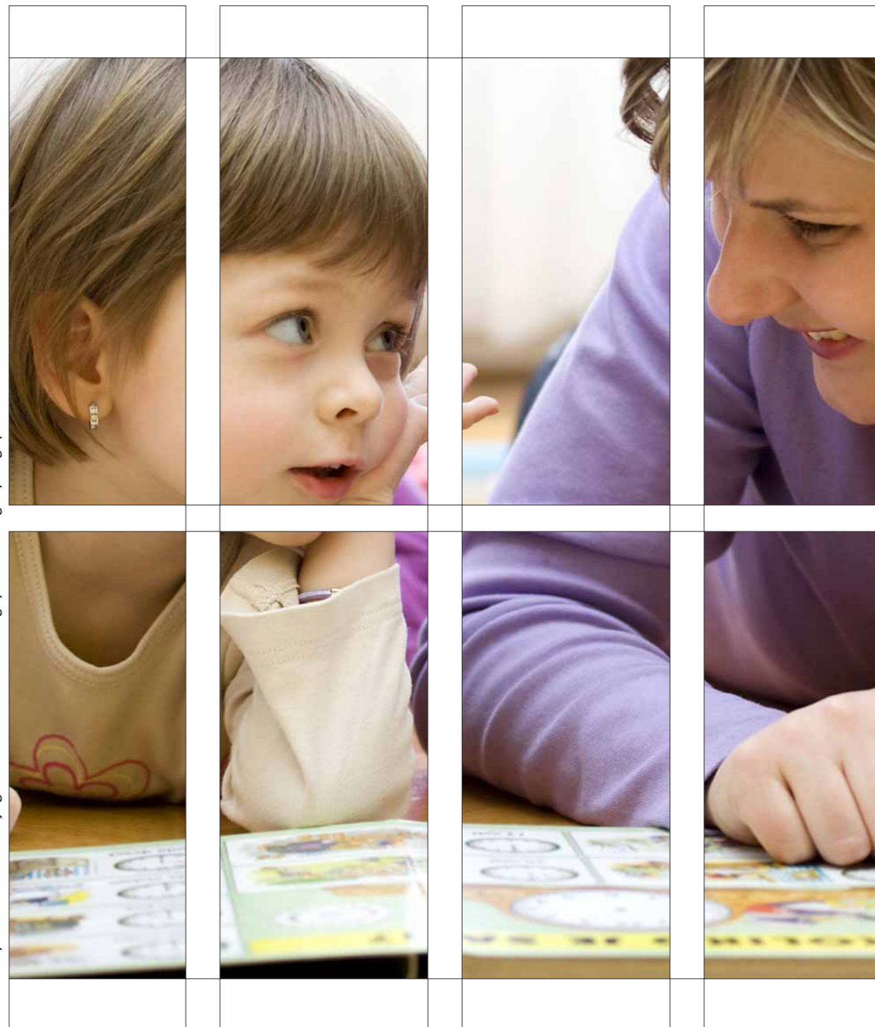
ZBFS – Bayerisches Landesjugendamt – Qualifizierungsplan für Tagespflegepersonen